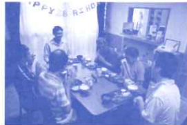
「わくわくホーム」入居の皆さん

グループホーム「わくわくホーム」が新しい建物に移転し、快適な住まいになりました。